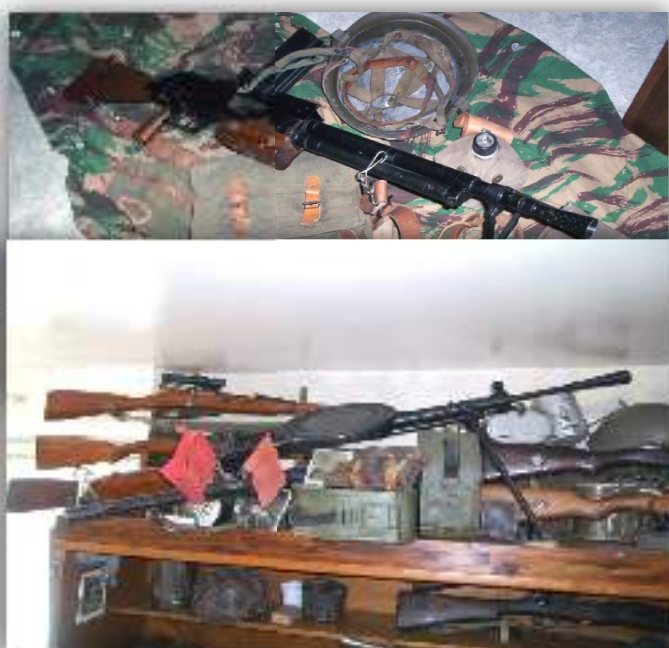
Armement soviétique 1939/1945

L'ensemble de ce matériel a traversé le temps en passant de générations en générations et l'Histoire doit pouvoir être visionnée par nos jeunes et leurs aînés .