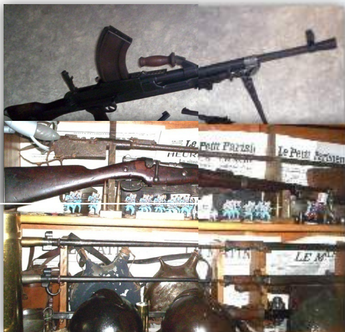
Mousqueton et matériels français 1914/1918