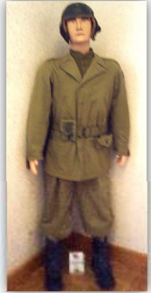
Tankiste américain 1945

Exposition sur la présence de l'armée américaine en Haute-Marne organisée par la municipalité de Bourg.