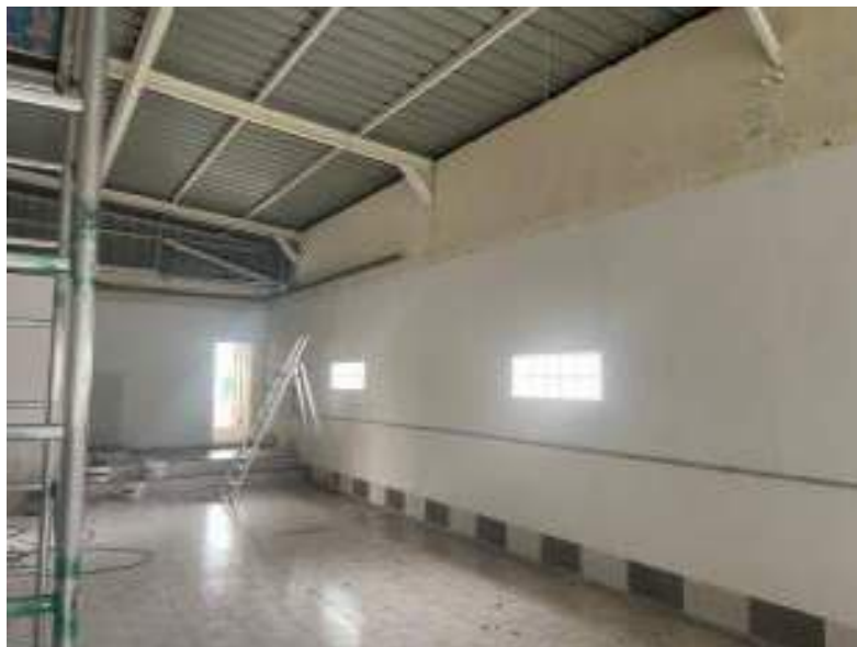
Vue de la salle contemporaine 107 m 2

(principalement la nuit) Ces matériels existent déjà dans les bâtiments mais ils devront être remis en service et leurs emplacements modifiés.