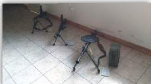
Matériels exposés dans l'une des salles.