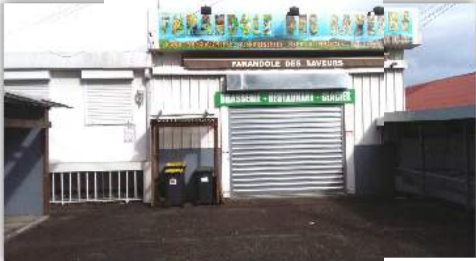
Façade et entrée actuelles du bâtiment