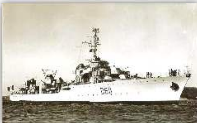
Le contre-torpilleur LE LEOPARD

Malheureusement la paix ne dure pas longtemps et seulement 21 ans après ce qui devait être « la Der des Ders », les pays européens se préparent de nouveau à l'affrontement. De septembre 1939 à juin 1940, 3 350 Réunionnais sont mobilisés et embarquent à la Pointe des Galets, 1500 sont affectés à MADAGASCAR, les autres gagnent la métropole. En quelques semaines l'armée française est vaincue et le nouveau gouvernement PETAIN signe la capitulation. Après l'armistice de juin 1940, dans le désordre et la confusion de la défaite, la REUNION se range, à l'image de la métropole, derrière le maréchal PETAIN. En mai 1942 les Britanniques s'emparent de MADAGASCAR et le 28 novembre une petite troupe des FORCES FRANCAISES LIBRES, amenée par le contre-torpilleur LE LEOPARD, débarque à la REUNION.