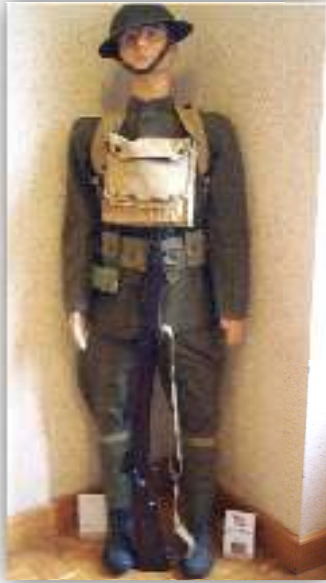
Fantassin américain 1918