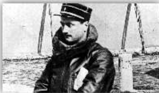
Le Lieutenant Roland GARROS

Durant la première guerre mondiale plus de 14 000 réunionnais sont mobilisés et environ 10 000 rejoignent les différents fronts pour lutter, aux côtés de leurs frères d'arme métropolitains et coloniaux, contre l'ennemi « teuton » (allemand), qui a violé le territoire national. Plus de 1 600 d'entre eux vont faire le sacrifice de leur vie pour la patrie et d'autres rentreront blessés, amputés, gazés, horriblement mutilés et souvent marqués psychologiquement à vie (la grippe espagnole de 1919 ajoutera plus de 7000 de ces soldats à la longue liste des morts). Impossible d'évoquer les héros réunionnais de la grande guerre sans citer le Lieutenant Roland GARROS tué lors d'un combat aérien le 5 octobre 1918.