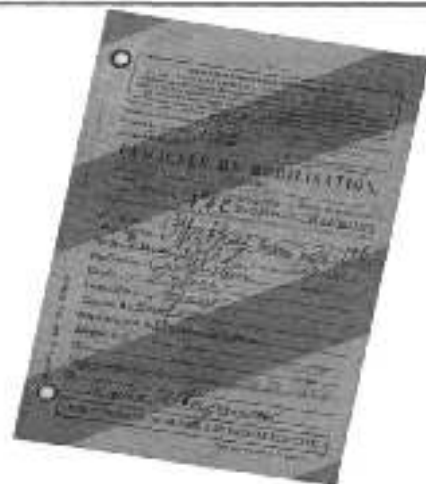
Ordre de mobilisation

Les visites sous la conduite de Gilles Goiset ont conduit soixante participants le samedi et cinquante le dimanche à la découverte de lieux qui n'ont pas changé depuis 1914 ou ont maintenu leurs façades à l'identique : ferme de la rue du Vau avec son sol de briques pour les vaches et de pierres pour les chevaux ; écurie du docteur Baudin (maison De Carvalho) ; caves de l'ancienne cure où ont logé les Américains au cours de l'hiver 1917-18 ; local des anciens pompiers avec tout le matériel du début du XX e siècle ; façades de l'épicerie Goiset et de l'hôtel du Mouton Blanc (maison Guyet) ; four du boulanger Etienne Guenet ; forge et sol de ferrage d'Auguste Garyet. Le départ a constitué un moment émouvant devant le monument aux morts avant de cheminer sur les quatre tombes de poilus dans l'ancien cimetière.