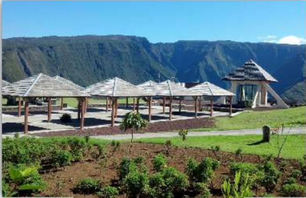
Belvédère de BOIS COURT

La situation des locaux s'avère être avantageuse, puisque proche d'une part du site panoramique de GRAND BASSIN (particulièrement fréquenté et notamment les week-end) et d'autre part de la CITE DU VOLCAN. Les visiteurs et touristes pourront ainsi saisir l'opportunité d'optimiser leurs déplacements en se rendant le même jour sur ces différents lieux.