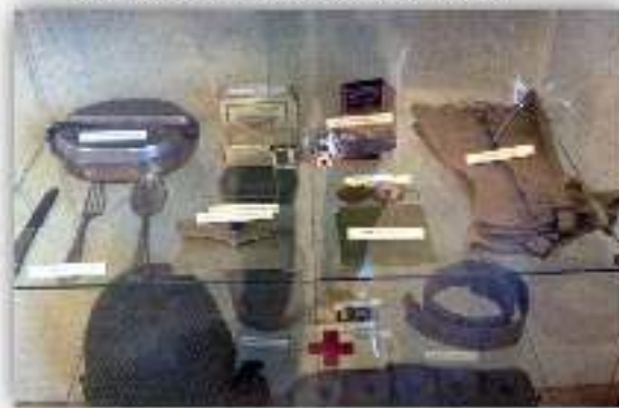
Matériel américain 1939-1945

Exposition sur la présence de l'armée américaine en Haute-Marne organisée par la municipalité de Bourg.