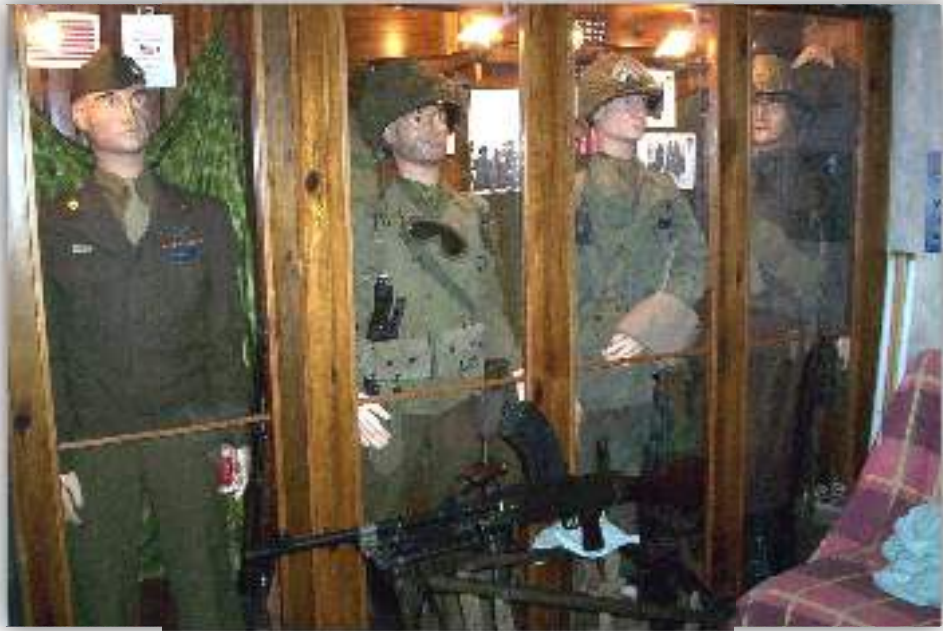
Mannequins présentant des aéroportés américains de 1944-1945 et FM Bren britannique sur affût.

Une importante documentation a été élaborée pour ce musée. Les objets sont identifiés par une étiquette.