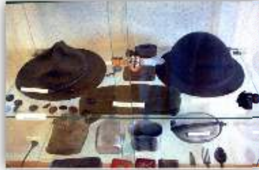
Matériel américain 1917-1918